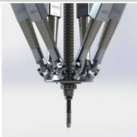
MAGPOD MAG SCHWEISSEN